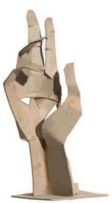
Mans , 1967. Projecte cartró, 22 cm d'alt

Llençol 2 , 2001. Tècnica mixta tela, 180 x 250 cm