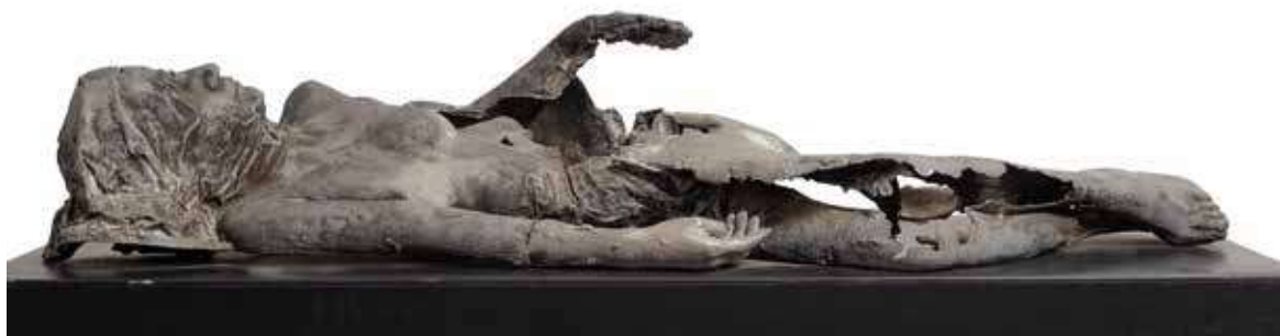
Destrossada, 1976. Alumini, 150 cm de llarg