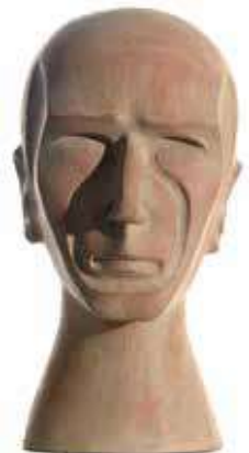
Autoretrats , 1988. 35 x 22 x 25 cm / 34 x 18 x 22 cm / 34 x 18 x 23 cm / 36 x 18 x 24 cm (sèrie)