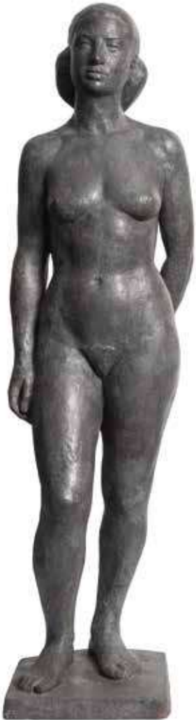
Paquita, 1947. Bronze, 98 cm alt

Domènec Fita sempre ha mostrat un interès especial pel nu al llarg de tota la seva trajectòria artística i personal. El nu produeix atracció i desig, i té una infinitat d'aspectes plàstics. Aquest espai està dedicat a totes les obres de l'artista que giren entorn del nu; des de les peces més primerenques i de formació acadèmica fins als diferents períodes de consolidació i consagració artística. Fita aprofundeix en el cos nu des de l'esquelet fins a la complexitat anatòmica, capta les subtileses de les formes, els colors i les textures de les carns, les línies i les ombres. L'espai és també un viatge des dels fonaments i l'aprenentatge acadèmic, fins al trencament i la superació dels propis fonaments del creador.