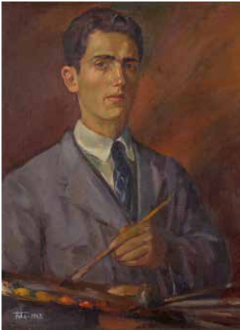
Autoretrat , 1947. Oli tela, 65 x 50 cm

ra de Sant Benet del Monestir de Montserrat –que havia de ser feta en pedra i sedent i acabarà optant per una figura dempeus i en ferro- l'escultura de l'abat Oliva de Vic i l'interessant proposta, projecte mai executat, d'un conjunt escultòric per a la portalada dels Apòstols de la catedral de Girona; obres que entronquen amb la tradició iconogràfica però a les quals Fita hi afegeix el seu bagatge artístic i n'executa una reinterpretació personal.