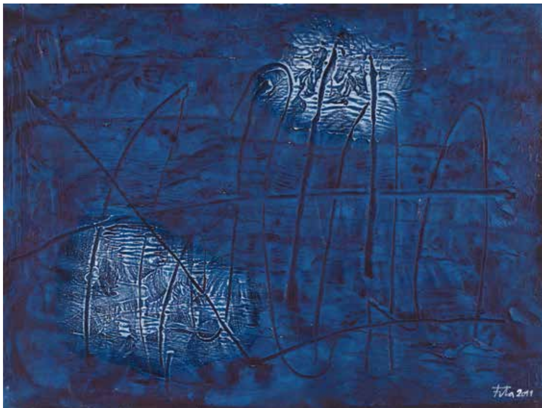
Mullat, 2011. Mixta tela, 60 x 60 cm