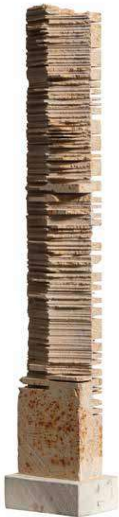
Pedres tallada , 1990. Pedra, 77 x 14 x 10 cm

Sant Andreu , 1961. Ferro forjat, 223 x 70 x 100 cm