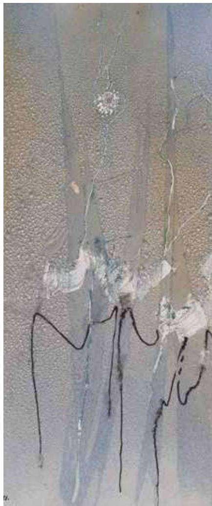
Primavera (fragment), 1991. Mixta, paper, 65 x 50 cm

L'exposició il·lustra aquest procés de creació de Fita amb algunes sèries pictòriques i s'acompanya d'elements que insisteixen en la fascinació de l'artista per la riquesa de les textures tàctils i visuals: motllos de guix, ceràmiques, pintures o ampliacions fotogràfiques. Aquests elements es disposen tenint en ment aspectes cromàtics i ambientals, amb l'objectiu d'apropar l'obra de l'homenatjat a la d'un seu deixeble, qui signa el muntatge d'aquesta secció expositiva.