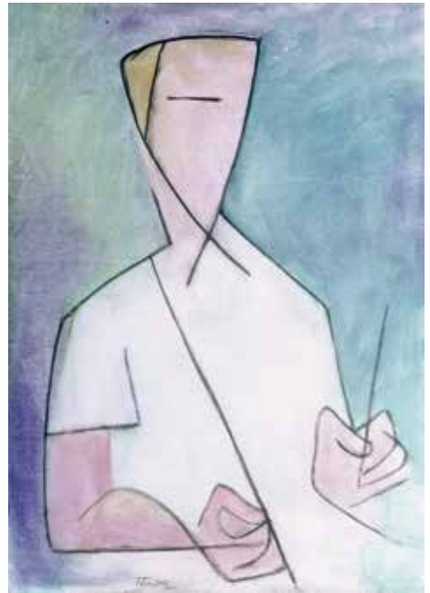
Autoretrat , 2001. Oli tela, 80 x 60 cm