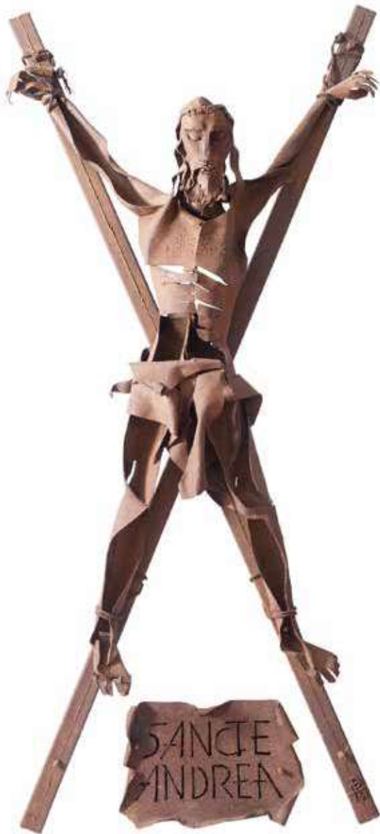
Sant Andreu, 1962. Ferro forjat, 223 x 70 x 100 cm