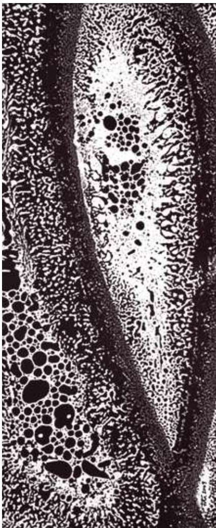
Fragment 3 , 2009. Digital, 110 x 50 cm (Sèrie Plòters)

Domènec Fita utilitza la geometria i la proporció en moltes de les seves obres, sovint d'art integrat; ho fa com a resposta racional i responsable a l'encàrrec. Tanmateix, l'ànima i el principal motor del treball de tots aquests anys de treball ha estat el "medi"; així ho anomena el propi artista. Aquest terme engloba la infinitud de formes i textures naturals i industrials que l'artista descobreix per atzar o cercant en piles de materials de rebuig i racons oblidats. Materials aparentment sense valor però que prenen una nova dimensió en el moment en què l'artista els aïlla i els manipula. Aquesta immersió en el medi allibera l'artista i l'obliga a la renovació constant.