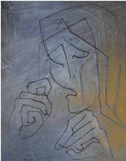
Dolor 2 , 1999. Tècnica mixta tauler, 61 x 48 cm