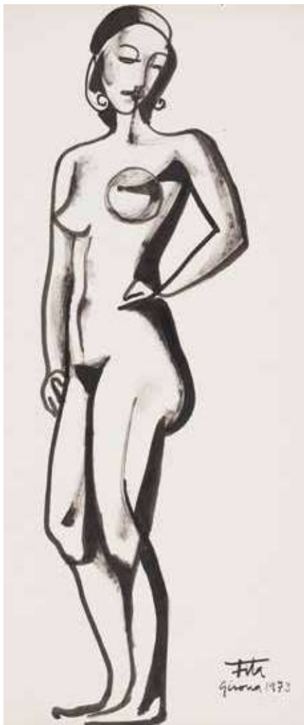
Apunts, 1973. Pinzell, canya tinta xinesa, 100 x 75cm