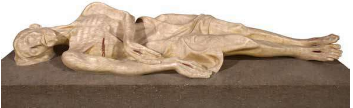
Crist Jacent, 1958. Alabastre, 190 cm de llarg (Capitol de la Catedral)