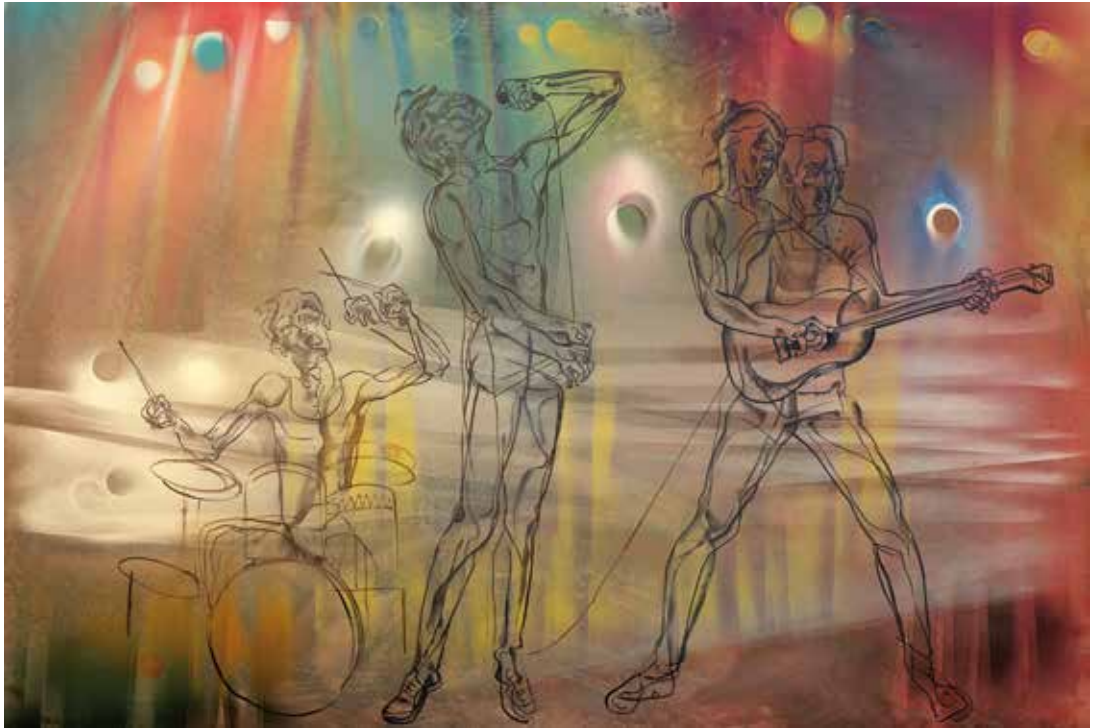
Lluís, 1984. Mitxa sobre tela, 200 x 300 cm