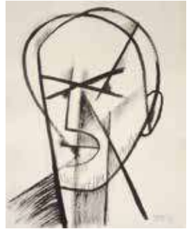
Autoretrats , 1993. Pinzell i tinta xinesa, paper, 36 x 38,5 cm (sèrie)