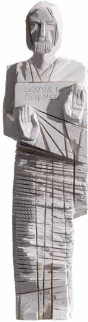
Grup escultòric dels Apòstols, 1994. Maqueta guix, 60 x 49 x 9 cm. (projecte)