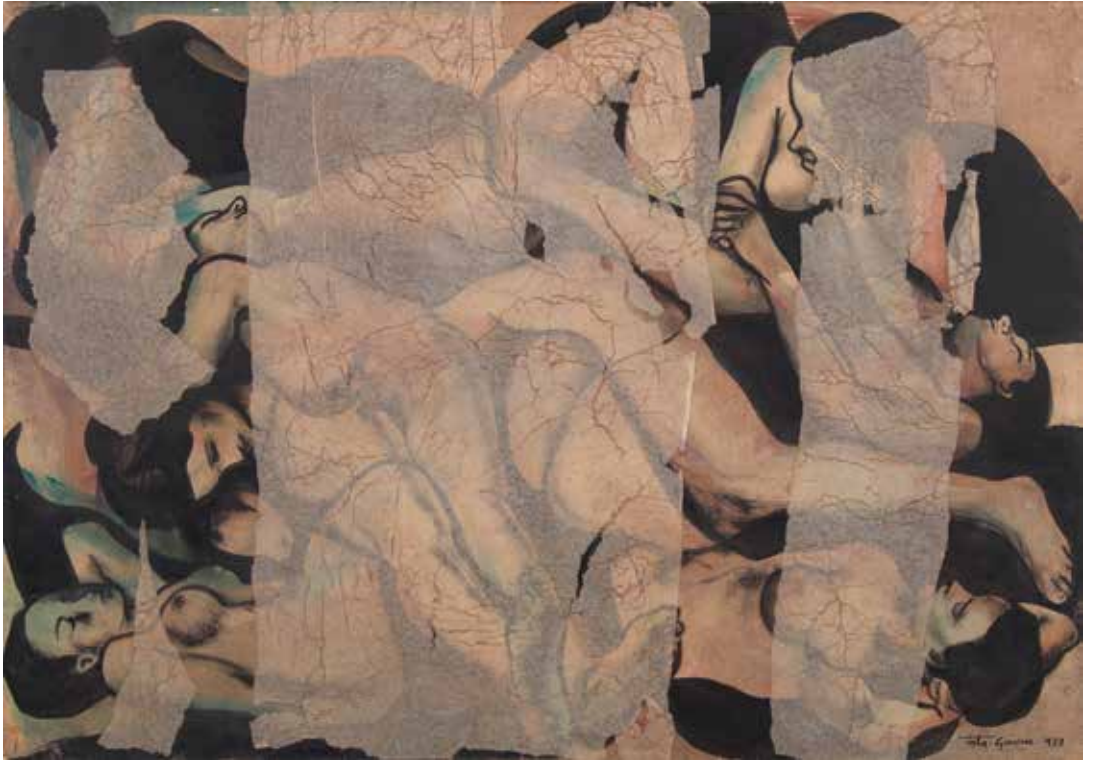
Barroc, 1973. Tècnica mixta tauler, 70 x 100 cm